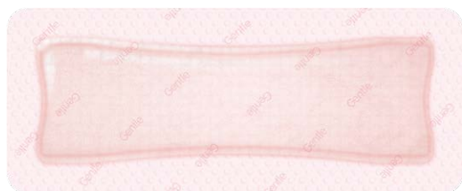
ALLEVYN Gentle Border 10 x 25 cm

ALLEVYN Gentle Border is uitgebreid met NIEUWE AFMETINGEN die gebruikt kunnen worden voor grotere oppervlakken, waaronder chirurgische wonden