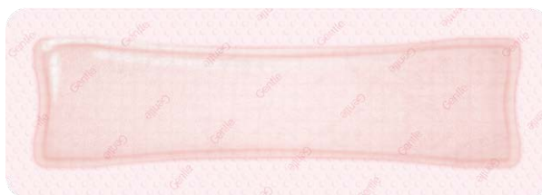
ALLEVYN Gentle Border 10 x 30 cm